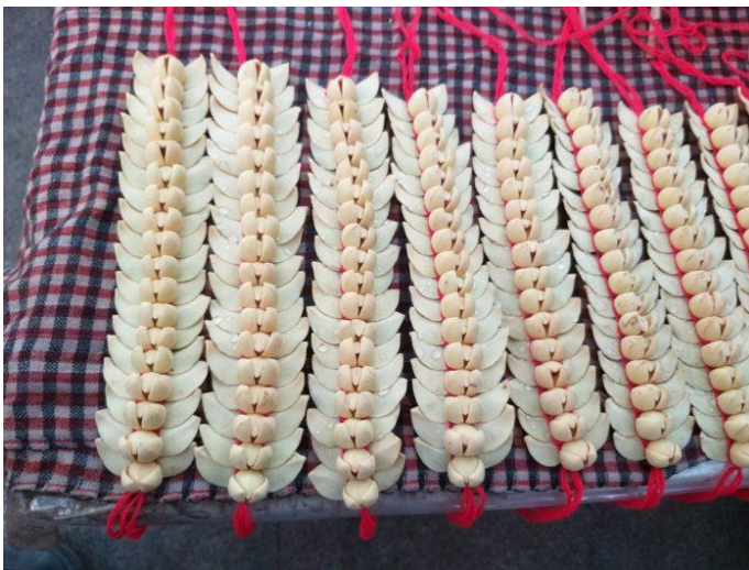
Bracelets vendus sur le marché aux fleurs de Siem Reap

En 2005 le Rumduol a été officiellement proclamé fleur nationale du Cambodge par décret royal et a également été enregistrée comme symbole de préservation de l'environnement par le gouvernement royal. Il y a plusieurs endroits au Cambodge qui portent son nom, dans la province de Sray Vieng et celle de Battambang. D'ailleurs, le centre où étaient logés nos collégiens avant d'intégrer Chup était à...Roumdoul !