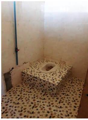
Salle d'eau du haut