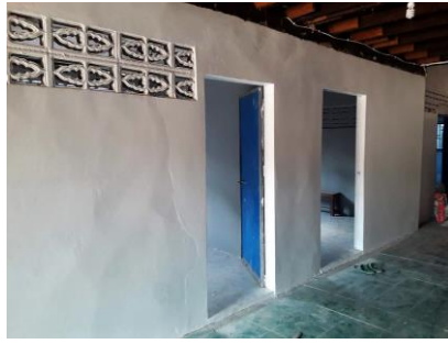
Bâtiment terminé !!!